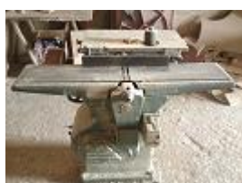
VERBA Nº17 - Uma plaina da marca ADERNA ..... € 250,00