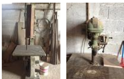
VERBA Nº18 - Uma serra de fita da marca PINHEIRO 120 SF 1/800, uma máquina de furar meia coluna sem marca visível ..... € 200,00