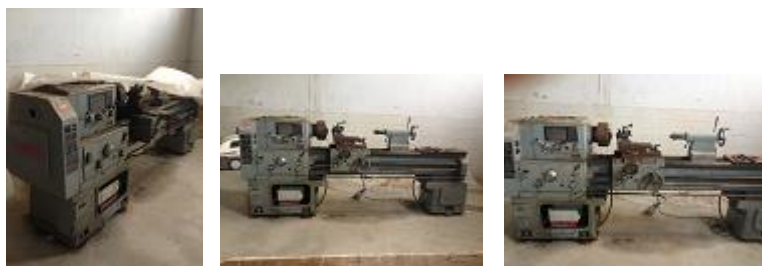
VERBA Nº11 - Um torno mecânico da marca CEGONHEIRA TMN150 ..... € 800,00