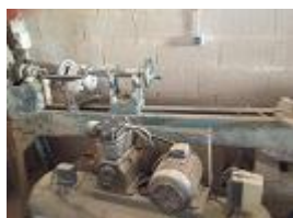
VERBA Nº15 - Um torno para madeira ..... € 100,00