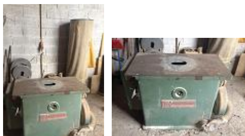
VERBA Nº19 - Uma tupa com aspiração da marca ZIMMERMAN ..... € 400,00