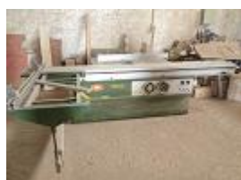
VERBA Nº14 - Uma esquadrejadora FAI MSW MAGIC ..... € 1.000,00