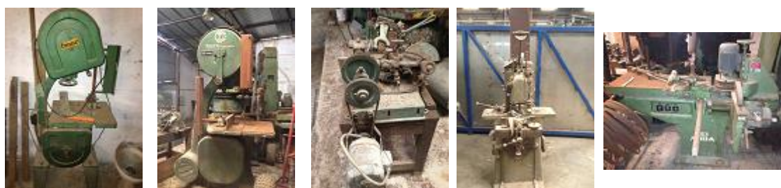
VERBA Nº13 - Uma serra de fita pequena da marca OMAC; uma galgadeira da marca MIDA SR3; uma serra de fita da marca PINHEIRO; uma máquina de afiar serra; um furador de corrente para madeira da marca PINHEIRO ..... € 500,00