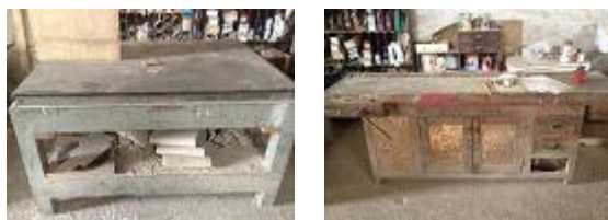
VERBA Nº20 - Um plano com mesa e duas bancadas de carpinteiro ..... € 30,00