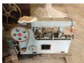
VERBA Nº12 - Um serrote eléctrico alternativo ..... € 100,00